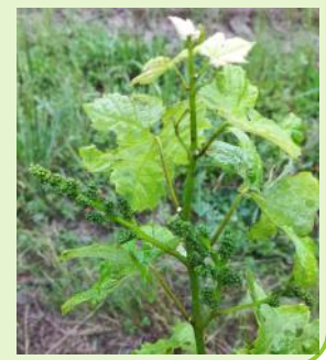
Duras, stade "boutons floraux séparés"

Le stade " boutons floraux séparés " est atteint sur les parcelles les plus précoces. La majorité des parcelles sont au stade "boutons floraux agglomérés". Sur les rameaux partiellement gelés, les entre-cœurs apparaissent. Les parcelles totalement gelées tardent à redémarrer.