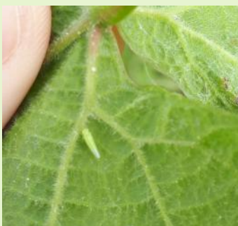
Adulte de cicadelle verte

A ce jour, le risque est nul. La gestion du ravageur repose sur une surveillance des populations larvaires. Le seuil d'intervention est de 100 larves pour 100 feuilles.