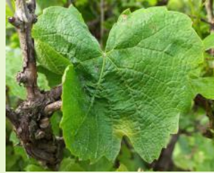
Mildiou sur feuille

Des taches isolées sont observées sur le vignoble.