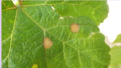
Taches de black-rot

attention à ne pas confondre des symptômes de phytotoxicité de désherbant ou des blessures avec des taches de Black-rot.