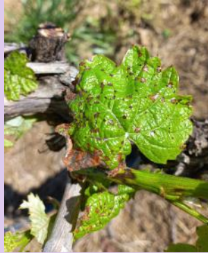
Phytotoxicité de désherbant