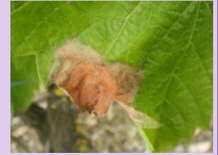
Botrytis sur feuilles

Suite aux conditions humides de ces derniers jours, des taches sur feuilles sont présentes sur le vignoble. Ces symptômes n'ont aucun lien avec les attaques qui pourraient avoir lieu sur grappes lors des vendanges.