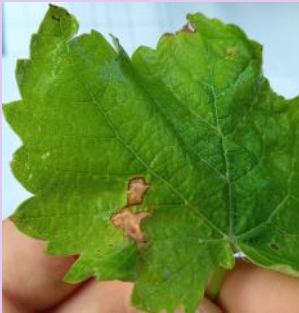
Blessures liées à des frotements